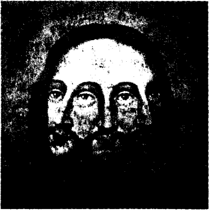
የፊርማው ባለቤት የሰለ ምስል በ19ፍ ወ ስርዓት ስሙን

ዛረ ከነኤፕርስ ጋር በጌታ ቤት መገኘትንም ምረጥ። በኢየሱስ ክርስቶስ ስም ለጋጠላትህ ሥርዓት ተጠምቀህ እጋውን ተቀበል። የመንፈስ ቅዱስ ስጦታችንም ተቀዳጅ። ለነፍሱም እረፍትን፤ ሠላምንና ፍትህንም ታቸለህ። በእግርህ ለመቆም የምትችለውና ከፕርፕር ነገ የምትሆነው ከዚያ በኋላ ነው። ለምን ትዘገይህ? የሐዋ.ሥ.ፊ.22፡16። እውነትን ብታውቅ እውነት አርነት ያወጣሃል። የሐ.8፡32። ቃሉ መርምረኝ ቸል ብለህ አትለፈኝ ይላሃል። መርምረህ ተረዳና ከፕፋት ዳን።